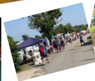
Farfouille du Comité des fêtes