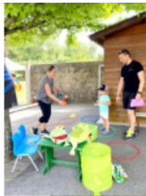
Kermesse Sou des écoles