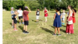
Vogue Karaoke et retraite aux flambeaux Municipalité et G.Bonant Production