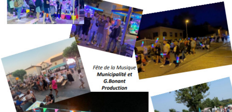
Fête de la Musique Municipalité et G.Bonant Production