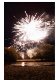
Feu d'artifice du 14 juillet Municipalité