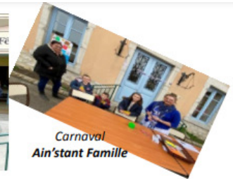
Carnaval Ain'stant Famille