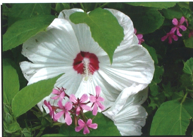
Un hibiscus de l'été Grande rue de la Côtère

Si vous avez envie de rejoindre notre équipe, n'hésitez pas à nous contacter pour partager ensemble ces activités mais aussi vivre des moments de convivialité dans une ambiance agréable.