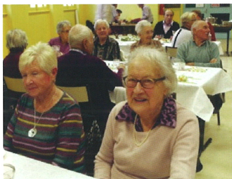
La poule au riz

Sous la conduite de l'ancien bureau de l'Amicale des Retraités, la saison 2015-2016 a encore amené à ses adhérents son lot de distractions habituelles. Le 14/01/2016, étaient fêtés les Rois avec la traditionnelle galette, c'était aussi l'occasion d'honorer les adhérents dont l'anniversaire rond tombe aussi cette année-là. Il y eut un anniversaire de 60 ans, un de 70 ans, deux de 80 ans et un de 90 ans.