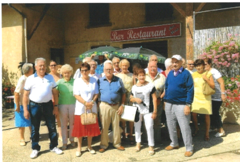
Un repas retrouvailles, le 28 août, dans une excellente ambiance dans un restaurant de Villette sur Ain.

Année calme pour les adhérents de notre petit comité des anciens d'Algérie.