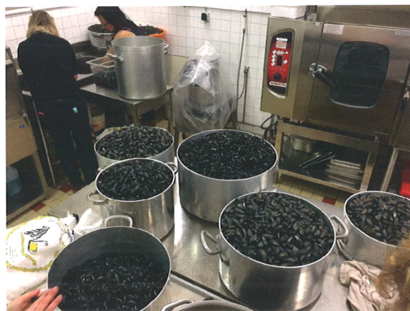
Les petites mains du Sou des Ecoles pour la soirée moules frites