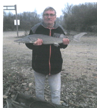
Le poisson du 15 janvier 2017 (Gaule Priaysienne) Priay 01460